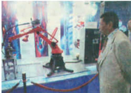
10月14日,在深圳举行的第三届中国国际高新技术成果交易会上,沈阳新松机器人自动化公司研制的RH6型焊接机器人以结构合理、可靠性高、性能先进、实用性强等特点,吸引了众多商家观看。

新闻热线 8330149 8331392 电子信箱 dyrb@sina.com 2001年10月17日 星期三 第174期 总第2537期 全国统一刊号:CN37-0054 邮发代号:23-172