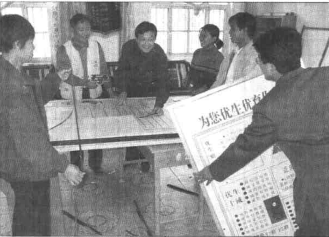
陈庄镇种田大户户均经营土地五十亩

河口讯 河口区委、区政府按照市委、市政府的总体部署，大力开展“城市规划管理年”活动。在继续坚持走好“政府组织、部门牵头、油地共建共管”建设城市的路子的同时，改革城市投融资体制，联合域内力量，推动对外开放，积极招商引资，加快了城市基础设施建设，切实解决了城市发展和人民群众关注的热点、难点问题，使城市建设显示出强劲势头。全区建设工作迅速跃入了全市先进行列，有些工作还在省和国家同行业中夺冠。 河口区委、区政府把“城市规划管理年”活动，列入全区工作重要议程。该区在规划过程中本着“因地制宜、突出特色、科学规划、合理布局”的原则，聘请知名专家对河口城区总体规划进行了重新编制调整，为城市建设提供了科学和法律依据。同时加强了城市专业规划和详细规划的编制，先后规划建设了海宁小区、河康小区等10余个精品小区，调整完善了环城水系、排水、绿化等10余项专业规划。 河口农贸市场改造工程已竣工并在近日投入使用。该项目通过拍卖土地使用权的形式，区政府不但分文不投入而且直接收入270万元，同时随着农贸市场的建设和繁荣，还可为社会提供近百人的就业机会。其他几个项目也正在按计划顺利实施中。 仅“城建年”活动和开展“城市规划管理年”活动以来，投资约5亿元，完成和正在建设项目70多个。新建和改造道路18条，新增道路面积72.94万平方米，新增绿化面积105万平方米，新增道路照明15.6公里。目前，全区建成面积达10平方公里，城区主干道18条，城区绿化覆盖率15.97%，人均公共绿地面积11.95平方米，3个生活小区绿化顺利通过省级验收。 河口正在高起点规划、高标准建设，为把河口区建设成为环境优美经济繁荣的新城区而努力。（韩荣华 陈立涛）