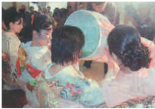
10月14日,在日本奈良,一名身着和服的妇女在同伴的帮助下用一只巨型茶杯品茶。该茶杯直径30厘米,重5公斤。这项活动每年举行一次,吸引了大批游客。