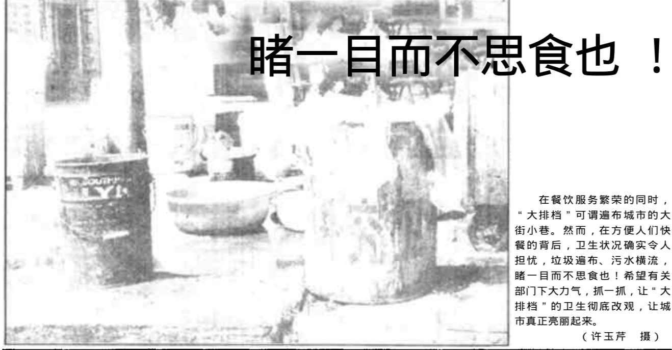
睹一目而不思食也！ 在餐饮服务繁荣的同时，“大排档”可谓遍布城市的大街小巷。然而，在方便人们快餐的背后，卫生状况确实令人担忧，垃圾遍布、污水横流，睹一目而不思食也！希望有关部门下大力气，抓一抓，让“大排档”的卫生彻底改观，让城市真正亮丽起来。

1至9月份，东营海关辖区加工贸易保持快速增长的发展态势，呈现如下三大特点：一、合同备案总值大幅增长。据统计，前三季度加工贸易合同备案总值6349万美元，同比增长4.76倍；二、加工贸易涉及的商品品种趋向多样化。加工贸易企业出口商品由去年较单一的纺织品、化工产品、农副产品、家具等四类商品逐步涉及到其他行业制品，如电子产品、橡胶制品、塑料制品、钢铁制